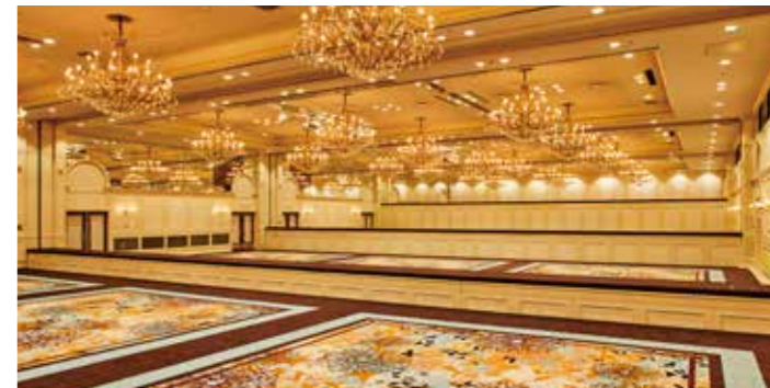
1番目、2番目、3番目の壁下降中